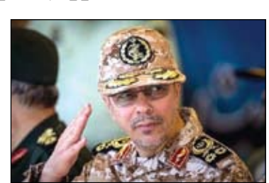
فرمانده کل نیروهای مسلح: عملیات انتقام با حداکثر ضربه به رژیم صهیونیستی است